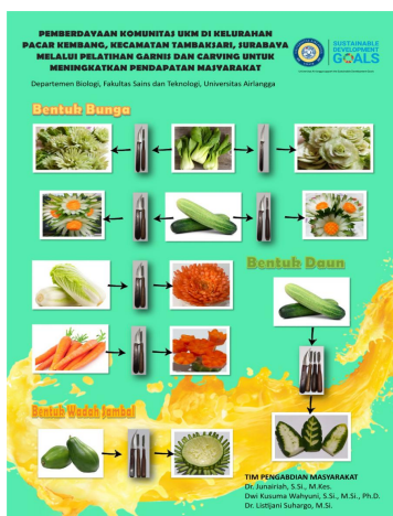
Gambar 1. Poster pembuatan garnis dan carving

Pada pelatihan ini peserta mendapatkan satu set pisau garnis dan carving, bahan sayuran meliputi mentimun, wortel, sawi hijau, sawi putih, dan buah pepaya, wadah plastik untuk merendam garnis dan carving, piring untuk menata hasil garnis dan carving serta poster panduan pembuatan garnis dan carving (Gambar 1).