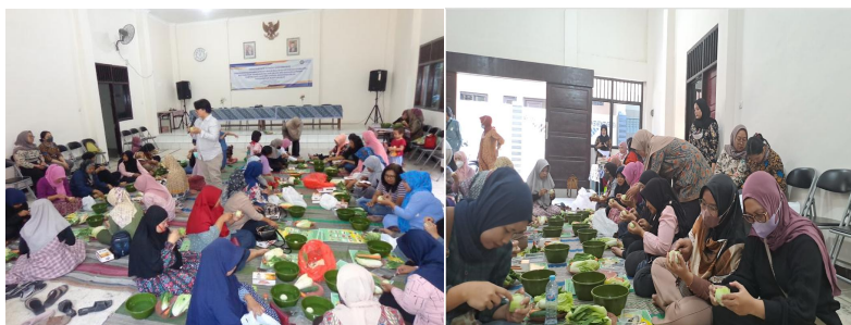
Gambar 2. Peserta UKM sedang melakukan praktek membuat garnis

oleh Dr. Junairiah, S.Si., M.Kes. Selanjutnya adalah pendampingan pembuatan garnis dan carving dengan metode ceramah, diskusi, peragaan dan praktek secara langsung. Materi ini dipandu oleh Yulia Yuniarti. Pada sesi ini peserta UKM diberikan materi tentang pemilihan bahan sayur dan buah sebagai bahan carving serta diberikan cara membuat aneka macam bunga dari sawi putih, sawi hijau, mentimun, wortel, serta daun dari mentimun. Selain itu diajarkan cara membuat wadah sambal dari buah pepaya mentah. Peserta langsung mempraktekkan dengan menggunakan pisau garnis dan carving (Gambar 2).