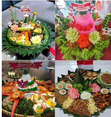
Gambar 4. Aplikasi garnis pada produk kuliner

Setelah praktek membuat garnis dan carving dilanjutkan dengan evaluasi yang terakhir yaitu postest. Untuk jumlah dan macam pertanyaan adalah sama ketika saat pretest. Tujuan dari postest adalah untuk mengevaluasi pengetahuan dari mitra terhadap materi garnis dan carving. Rerata nilai pretest adalah 80,65, sedangkan rerata nilai postest adalah 87,78. Berdasarkan