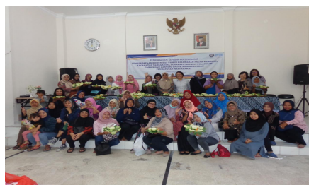
Gambar 6. Sesi foto bersama dengan mitra UKM kuliner