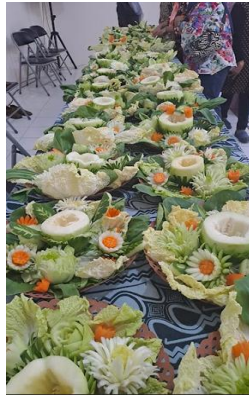
Gambar 3. Penataan hasil garnis dan carving