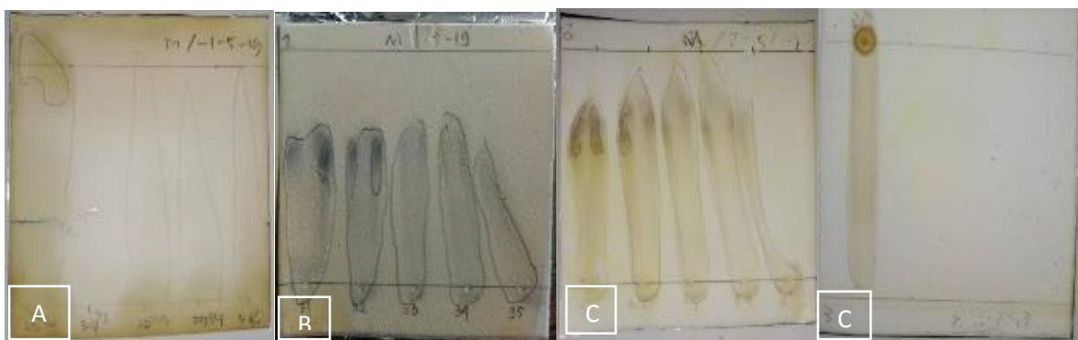
Gambar 3. Hasil KLT Spray pada Fraksi 33-36 Ekstrak Metanolik meniran ( Phyllanthus niruri L. )

P.niruri linn terdapat pada gambar 3 dan tabel 2. Pada penelitian ini pengujian dilakukan menggunakan metode KLT spray pada fraksi 33-36.